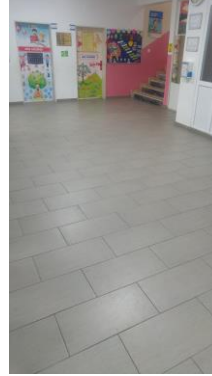
Koridordan Bir Kare