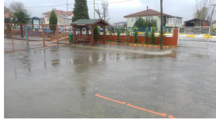
Okul Bahçesinden Bir Kare